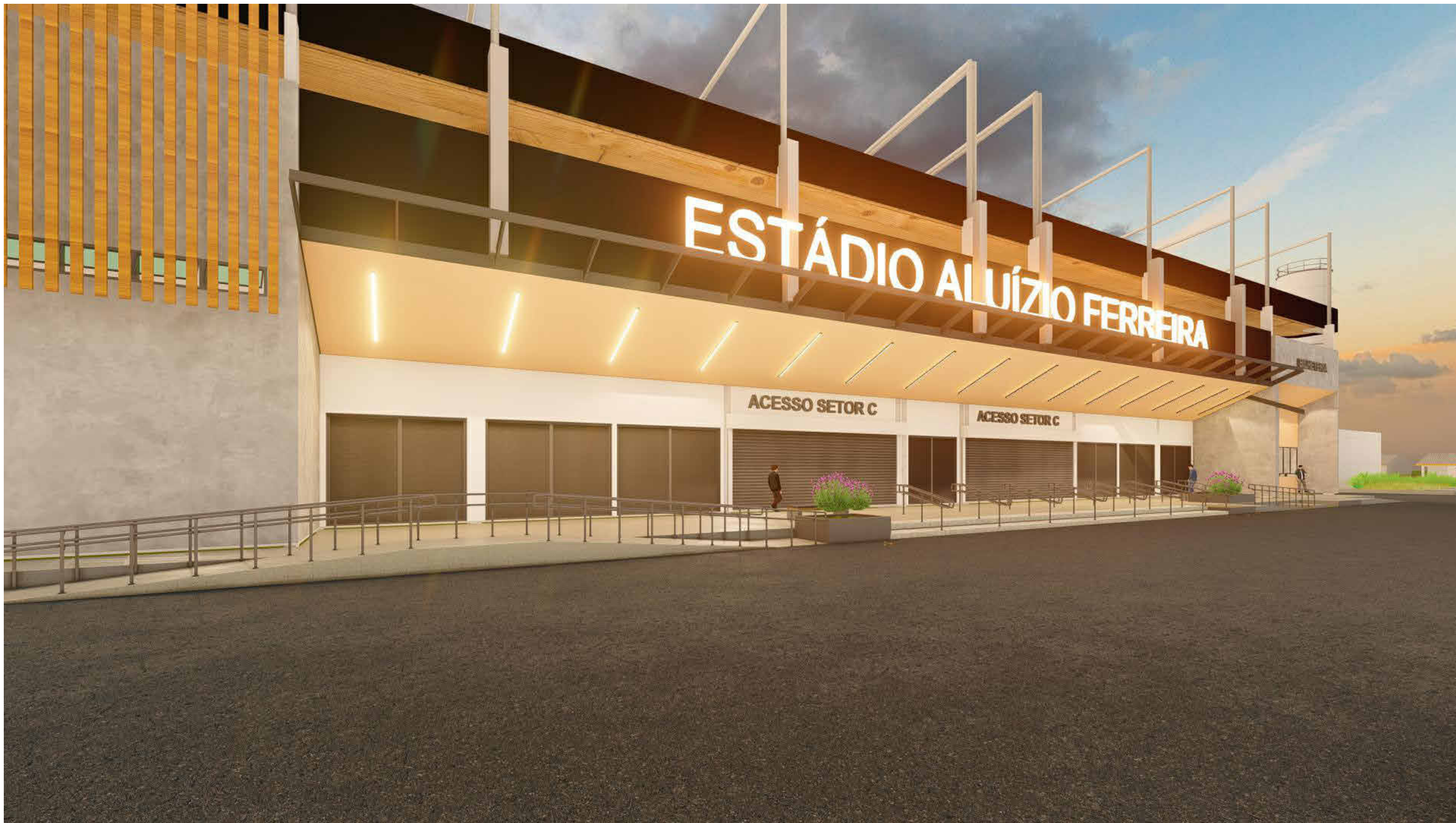
IMAGEM 1 - ACESSO SETOR C