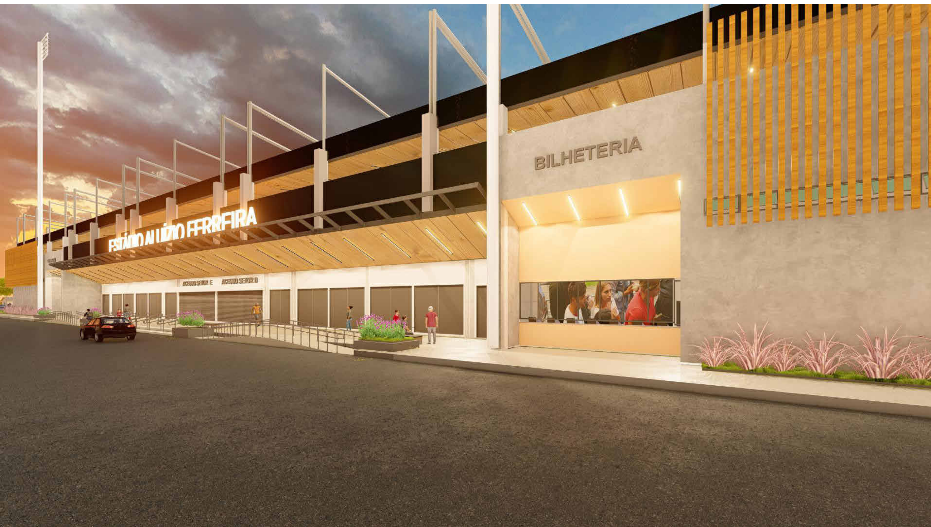
IMAGEM 2 - ACESSO SETOR C/D